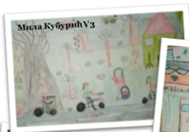
Мила Кубурић V3