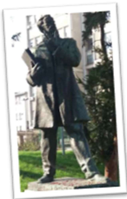
Споменик Васи Пелагићу испред дечије клинике „Тиршова“

Школа носи назив у част Васи Пелагићу, народном просветитељу и борцу за реформу и унапређење школства.