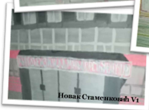
Новак Стаменковић V1